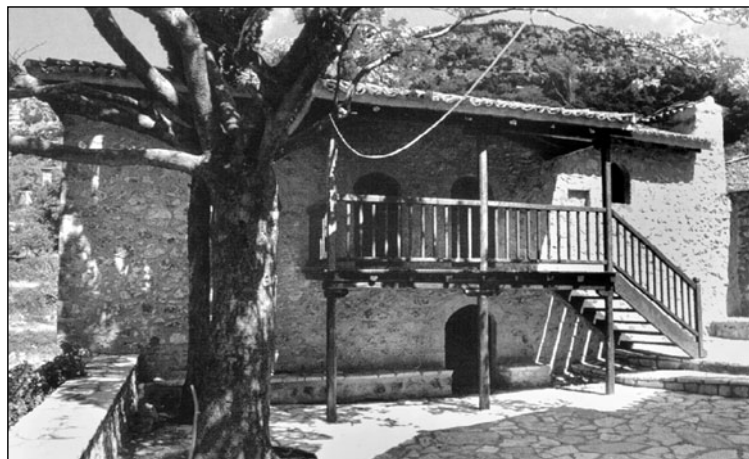
Μονή Χρυσοπηγής. Το κελί των συνεδριάσεων της Α΄ Πελοποννησιακής Γερουσίας.

Ο Συνδεσμος για να συμβάλει στην επιτυχία της εκδήλωσης θα διαθέσει πούλμαν που θα αναχωρήσει το Σάββατο 9/6 και θα επιστρέψει το βράδυ της Κυριακής 10/6/2012 . Πληροφορίες κ. Χαράλαμπος Χασάπης, τηλ. 210 3252457.